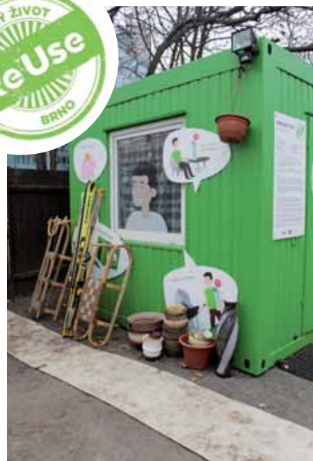
RE-USE point na jednom ze sběrných dvorů s věcmi, které zde lidé nechali k dalšímu použití