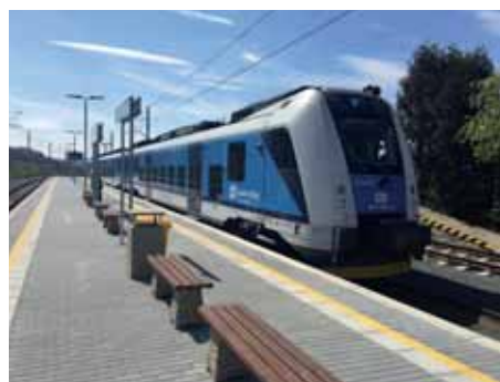
Na trať zajíždějí se svými vlaky i České dráhy

dosud. Region se také více otevře turistům a dalším návštěvníkům zejména z řad obyvatel větších center Olomouckého kraje, jako jsou Olomouc, Prostějov, Mohelnice nebo Zábřeh na Moravě.