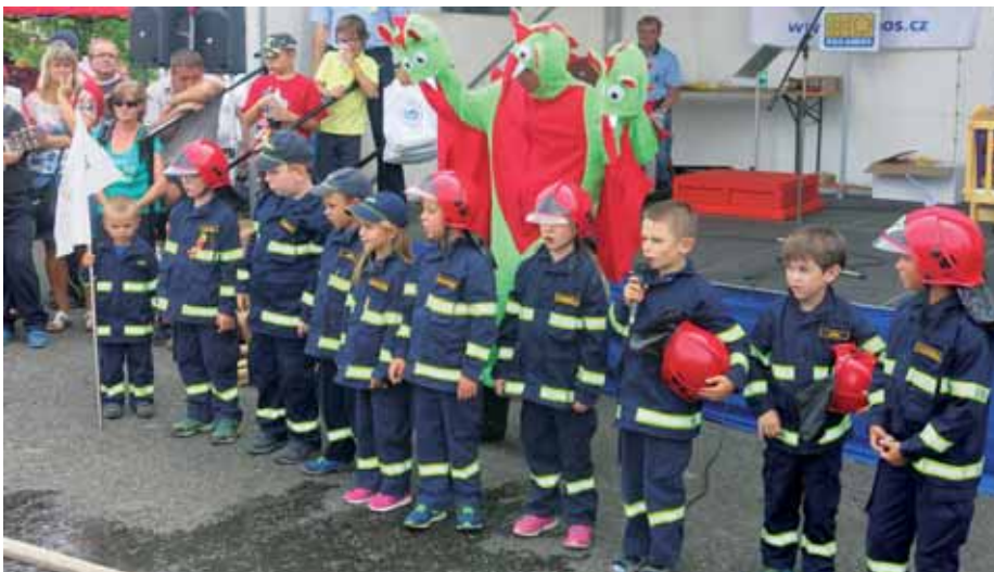
V dětské hasičské jednotce mají němčovičtí soptíci příležitost naučit se zábavným způsobem zodpovědnosti, spolupráci a koordinaci práce