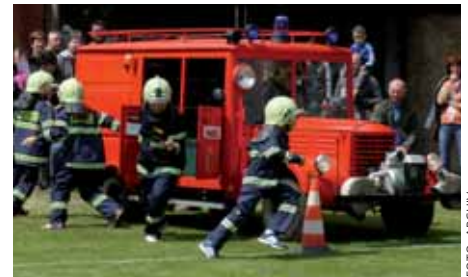
Červené autíčko, které si předškoláci z Němčovic řídí sami, uveze až sedm soptíků