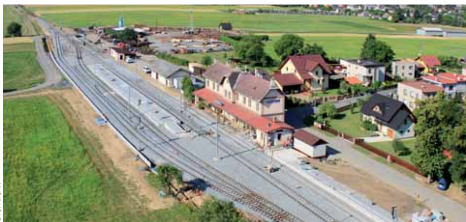
Zastávka v Petrově nad Desnou

T oto propojení umožňuje vést osobní vlaky bez přestupů jak pro místní dopravní obslužnost v relacích Zábřeh na Moravě – Kouty nad Desnou, tak pro napojení na krajskou metropoli Olomouc. To vše v jízdních dobách konkurenceschopných silniční dopravě. Traťová rychlost totiž může být v některých úsecích zvýšena až na 80 km/h z původních 40–70 km/h. Nejenže se tím zkrátí jízdní doby, ale také se zvýší kultura cestování a bezpečnost vlakové dopravy.