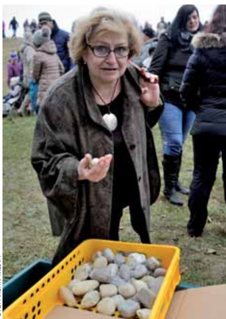
POKLÁDÁNÍ ZÁKLADNÍHO KAMENE – VĚRA ČÁSLAVSKÁ

■ Starosta Černošic stál v pozadí celého projektu, byl, jak se říká, otcem myšlenky. Navzdory několika neúspěšným žádostem o dotace se po čtyři roky nevzdával a od července 2014, kdy mu kladná odpověď z Ministerstva financí přiblížila úspěšnou realizaci této myšlenky, se až do dne slavnostního otevření 2. června 2016 takzvaně nezastavil.